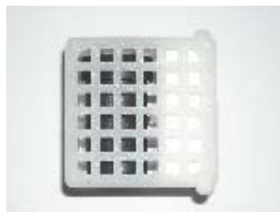
Atrayente Pherosan Ceratitis